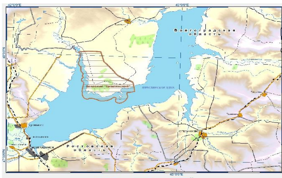
Рисунок 3 – Карта-схема ФГБУ Государственного заповедника «Ростовский»

Ростовская область. К Цимлянскому водохранилищу примыкает природный парк « Цимлянский », расположенный в Цимлянском районе на границе с Волгоградской областью (рисунок 3), который предназначен для сохранения и восстановления редких и исчезающих видов растений и животных, в том числе ценных видов в хозяйственном, научном и культурном отношении.